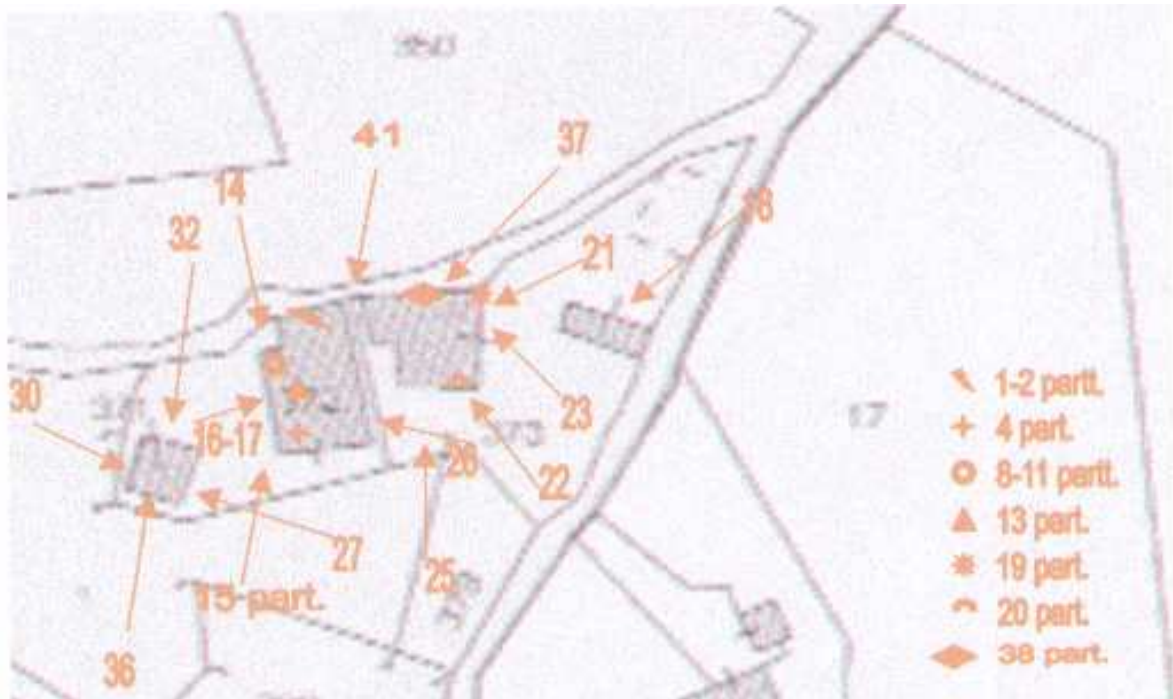
Punti di ripresa fotografica